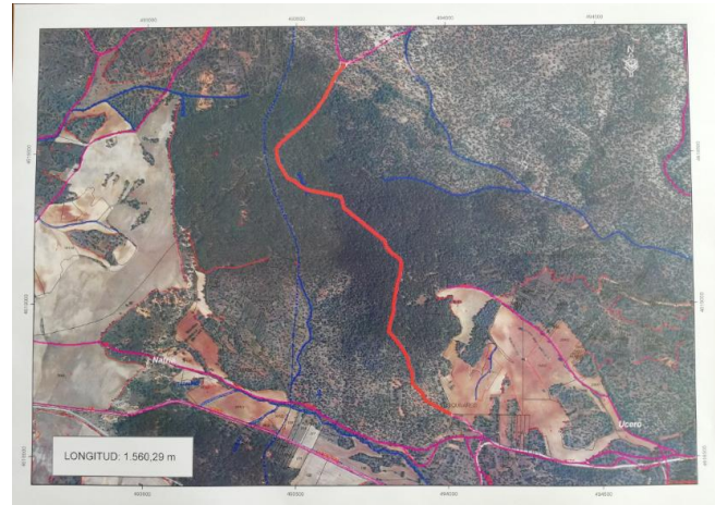
Imagen con la ubicación del Primer Cinturón Contra El Fuego en los Montes de Ucero, P.N. Cañón del Río Lobos.

Las labores preventivas comenzarán a ejecutarse a mediados de mayo, terminando a final de dicho mes. Con el desbroce del matorral, poda de ramas bajas, y eliminación de árboles secos y enfermos, recuperamos la biodiversidad del Espacio Natural, reducimos la carga de combustible, interrumpimos su continuidad vertical, y hacemos que determinadas zonas sean accesibles para que los medios de extinción puedan trabajar con mayor rapidez y eficacia caso de ser necesario.